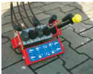
Commande à distance mécanique livrable en option.