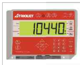
Pesée programmable 3600 V livrable en option.