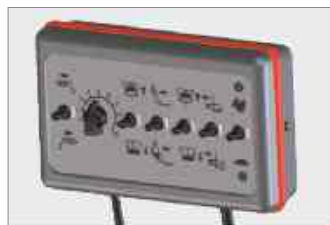
Commande électrique livrable en option.