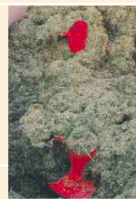
Mélange parfaitement aéré avec maintien de la structure.