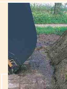
Un ensilage lisse et bien propre, découpé à la perfection jusqu'au fond.