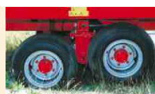
Les types Triomix 2 sont équipés d'origine d'un essieu tandem avec 4 roues indépendantes.

Tout un chacun pouvant conduire un tracteur pourra utiliser sans autre problème la Triomix. De par sa construction robuste, ses larges pneus et sa bonne visibilité sur l'arrière, la machine est très maniable. Au début du fourrage quotidien vous roulez la Triomix en marche arrière contre l'ensilage avec le bec de découpe monté en l'air, tout en glissant avec souplesse la pelleuse avec rouleaux d'appui sous l'ensilage. Avec un simple mouvement de levier vous entamez le processus de découpe: la force doublée du bec de découpe, solide et légèrement courbé se manifeste aussitôt. Car autant la hauteur maximale de désilage de 3.15 m. (même de 4.90 m. pour le type Triomix 2, 2000), que la largeur du champ d'action (de 2.04 m. au minimum à 2.24 m. au maximum) vous permettent de découper d'une traite 3.2 mètres cubes d'ensilage en moins de deux minutes!