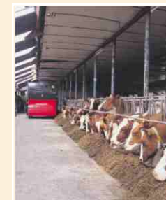
Le fourrage est distribué loin hors roues. La distribution s'exécute d'une façon bien ordonnée et rapide.

Après le découpage et le chargement il vous reste un ensilage lisse et bien net. Il reste intact et en maintenant sa structure, il est insensible à l'échauffement ou à toute autre détérioration du fourrage. Un résultat de découpe absolument parfait, ce qui n'est pas toujours le cas avec des couteaux, des fraiseuses, des dents ou d'autres "avaleurs". Le travail avec la Triomix terminé, il n'est même plus nécessaire de sortir un balai.