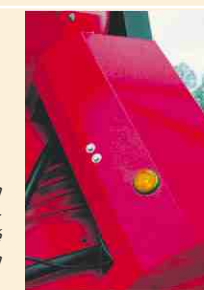
Une lampe témoin indique que l'ensilage est découpé jusque sur la pelleuse.