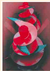
Les deux vis verticales à couteaux garantissent un mélange parfait avec maintien de la structure.